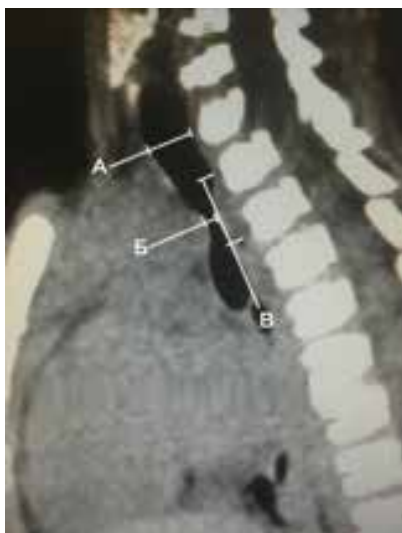
Рис. 1. КТ органов грудной клетки, боковая проекция: А – диаметр трахеи ниже перстневидного хряща, Б – диаметр на уровне стеноза, В – протяженность стеноза.

перикарда. Мобилизация средней и нижней трети трахеи, главных бронхов. Выявлена зона стеноза протяженностью 8 миллиметров с дивертикулом, расположенным выше нее. Выполнена ЦРТ выше и ниже зоны последней на 5 мм, наложен анастомоз «конец в конец» (рис. 2). Задняя стенка трахеи ушита непрерывным швом, фиброзно-хрящевая часть за ligamentum anularia – восьмиобразными швами Surgipro 5/0 (рис. 3). Интраоперационная ЛТБС: анастомоз состоятелен, просвет достаточный. Дренажи в правую плевральную полость и переднее средостение. Продолжительность этапа реконструкции трахеи с сопутствующей санационной бронхоскопией составила 30 минут.