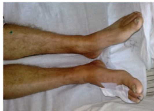
Рис. 2. Внешний вид голени на 3-и сутки после забора вены, отек отсутствует

Во всех случаях ко вторым суткам развивался стойкий выраженный лимфо-венозный отек бедра и голени (до +8 см в окружности) на стороне, где забирали бедренную вену. К 4-5 суткам во всех случаях появилась упорная лимфорея. У всех пациентов участок разреза на уровне паха на этой ноге заживал вторичным натяжением. Все остальные операционные раны зажили первично. Во всех случаях для реабилитации потребовалось значительное время (около 30 суток) с лечением в отделении хирургии сосудов и с последующим переводом в отделение гнойной хирургии. Внимания гнойных хирургов преимущественно требовали трофические язвы и лимфорея из разреза на ноге со стороны забора вены.