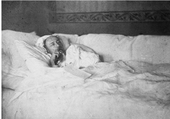
Н.А. Некрасов, 1877 г.