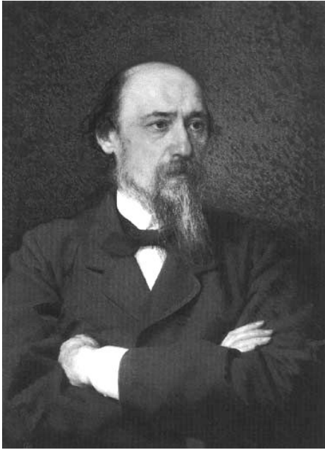
Н.А. Некрасов со сложенными руками (И.Н. Крамской, 1877)

мя он задался целью собрать в своей галерее портреты выдающихся людей России. Портрета Некрасова у него не было. Третьяков обратился с просьбой к художнику И.Н. Крамскому. И.Н. Крамской начал работу в 1877 году. В это время поэт работал над созданием знаменитого цикла стихотворений «Последние песни», в котором он с новой силой, с творческим порывом и необычайной искренностью чувства вспоминал о матери, рисовал картины своего детства и страдал от сознания совершенных в жизни ошибок.