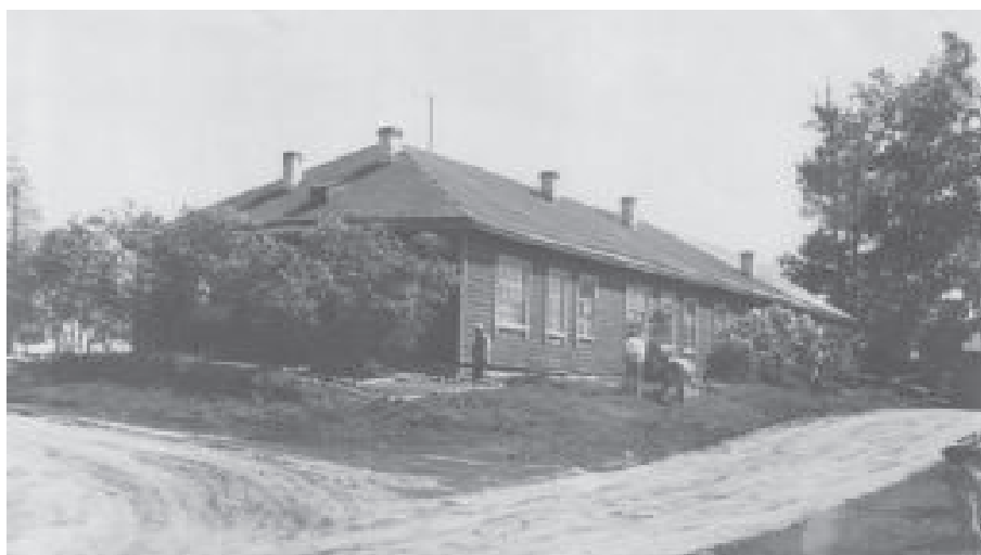
Рис. 2. Слободская центральная районная больница Смоленской области.