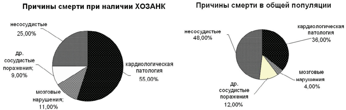
Рис.1. Структура смертности у больных хроническими окклюзирующими заболеваниями нижних конечностей (ХОЗАНК) и в общей популяции.

дца и онкологических заболеваний[6]. Приблизительно 600 000 человек в год страдают от острых нарушений мозгового кровообращения в этой стране. Это приводит к 160000 смертей и делает большое количество больных инвалидами. В РФ частота ишемических инсультов составляет около 500 случаев на 100 000 населения с 40% летальностью при первичном эпизоде [7].