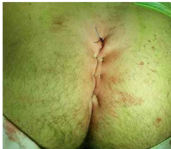
Рис. 2. Вид послеоперационной раны после иссечения ЭКК с закрытием раны непрерывным швом с подхватом дна раны.