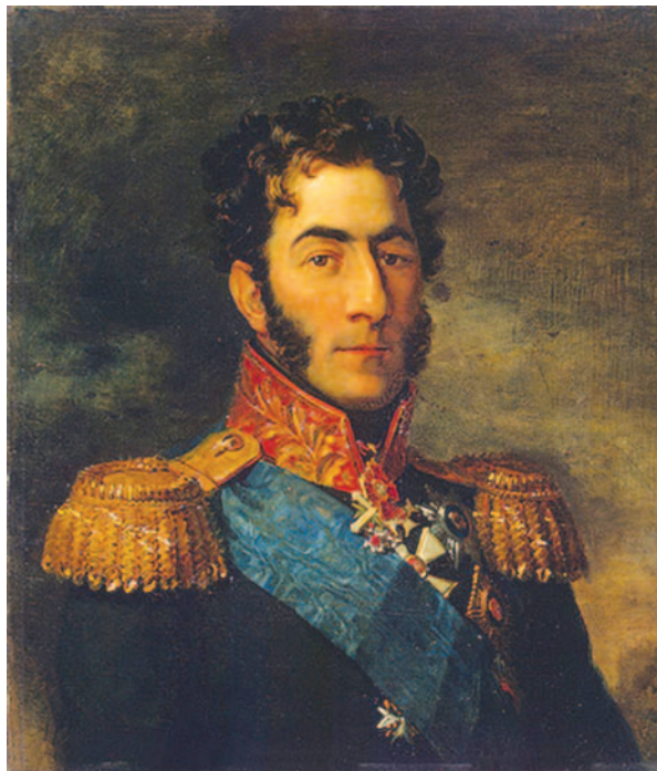
П.И. Багратион (Худ. Джордж Доу. 1825 г.)

скончавшимися от ран, и 48 тыс. заболевшими и ранеными [1]. Как видно, огромное число людей, участвовавших в боевых действиях, нуждались в оказании медицинской помощи.