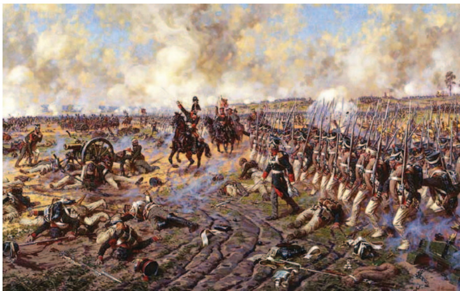
Князь Багратион в Бородинском сражении. Последняя контратака.

Оно было кратковременным, повлекло за собой оставление флешей, но затем сражение разгорелось с новой силой. По свидетельству очевидцев, князь Петр, когда его несли в тыл, просил передать Барклаю-де-Толли «спасибо» и «виноват»: «спасибо» — за стойкость соседней 1-й армии в сражении, «виноват» — за все, что раньше Багратион говорил о военном министре [7]. Известно, что Багратион до этого очень плохо относился к Барклаю и нещадно его критиковал за постоянное отступление 1-й Западной армии под напором главных сил наполеоновской армии.