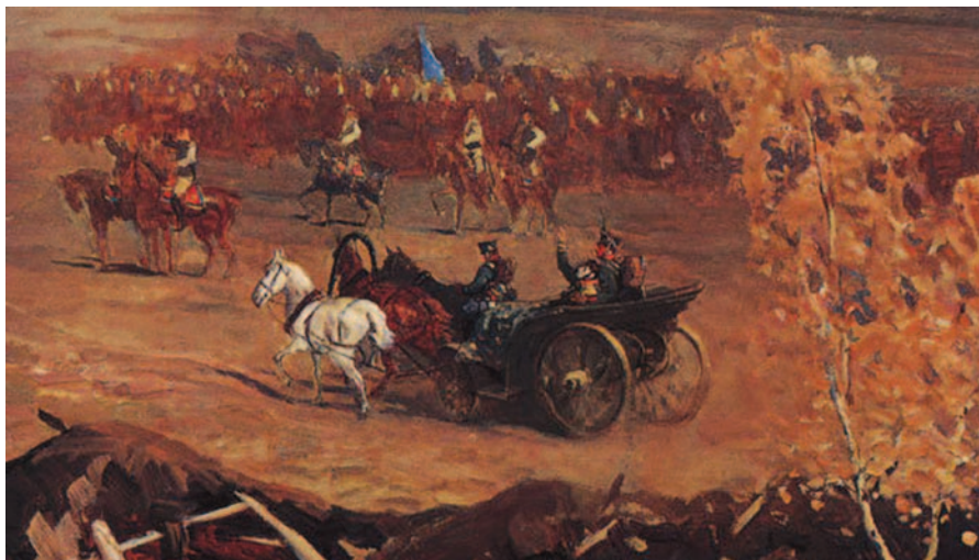
Раненого Багратиона увозят с поля боя (Худ. И.В. Евстигнеев, 1962 г.)

14 сентября (2 сентября по старому стилю) в 9 часов утра князя Багратиона по Владимирской дороге вывезли из Москвы. Вечером он согласился опять начать принимать лекарства. «Рана его в перевязке представляла весьма количественное нагноение и скрывающая под оным глубокую полость, из которой вытискивался смердячий гной» [3]. На следующий день 15 сентября (3 сентября по старому стилю) кортеж отправился в путь, но к 2 часам пополудни в посаде Сергиевской Лавры решили остановиться, т.к. князь из-за усиления болей и слабости не смог продолжать поездку. Вечером Я.И. Говоров, проводя перевязку, отметил ухудшение состояния раны. «При перевязке раны ощутительно было зловоние. Самый гной в качестве своем изменился. Берцовая кость на самой середине показывалась косвенно поврежденной. Такое состояние