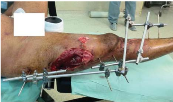
Рис. 1. (к статье А.А. Лернера с соавт.) Наружная фиксация правой нижней конечности с временным блокированием коленного сустава при помощи стержневого аппарата наружной фиксации Damade control при лечении открытого перелома правого бедра с дефектом мягких тканей и закрытого перелома правой голени