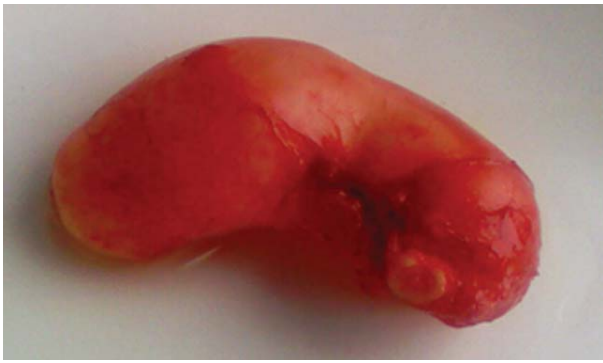
Рис. 2. (к статье И.В. Мишина с соавт.) Макропрепарат удаленного мукоцеле червеобразного отростка