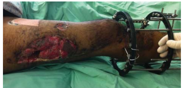
Рис. 2. (к статье А.А. Лернера с соавт.) После общей стабилизации пострадавшего выполнена внутренняя фиксация бедренной кости стержнем. Открытое ведение раны бедра. Перелом голени фиксирован аппаратом Илизарова