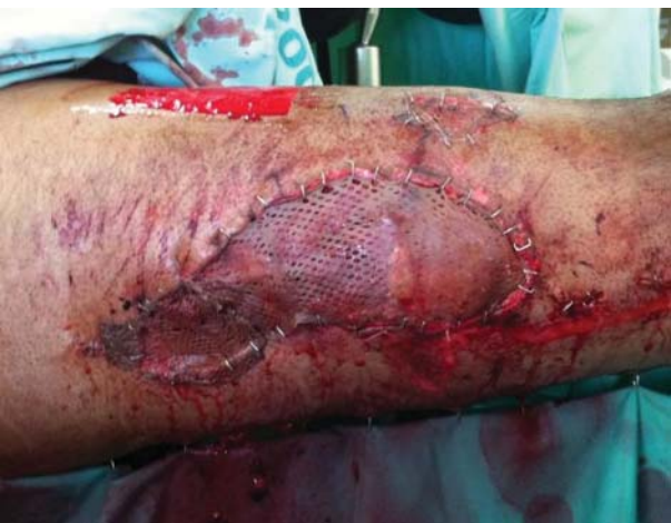
Рис. 3. (к статье А.А. Лернера с соавт.) Гранулирующая рана правого бедра укрыта расщепленным кожным лоскутом