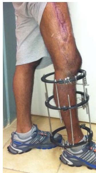
Рис. 4. (к статье А.А. Лернера с соавт.) Полная ранняя функциональная нагрузка на правую нижнюю конечность в процессе лечения