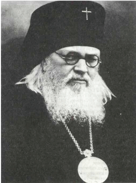
Валентин Феликсович Войно-Ясенецкий

хирургической инфекции не потеряли своей актуальности, а топографо-анатомические данные о клетчаточных пространствах человеческого тела и путях распространения гнойной инфекции могут быть дополнены, но не могут быть превзойдены.