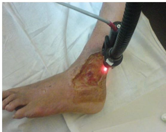
Рис. 1. Проведение фотодинамической терапии язвы голени аппаратом «Родник-1».

При исследовании количества микробных тел в 1 г ткани раны или язвы нижних конечностей выявлено, что в день поступления пациентов в стационар исходная обсемененность превышала «критический уровень», составив в среднем 3,1 \times 10^9 со статистическим разбросом в вариационном ряду от 10^{10} до 10^7 . После хирургической обработки количество микробных тел в 1 г ткани уменьшилось в среднем до 4,1 \times 10^5 . После применения методики ФДТ аппаратом «Родник-1» с фотосенсибилизатором «Хлорофиллипт» происходили существенные изменения. На 3 – 4-е сутки после некрэктомии в основной группе отмечалась