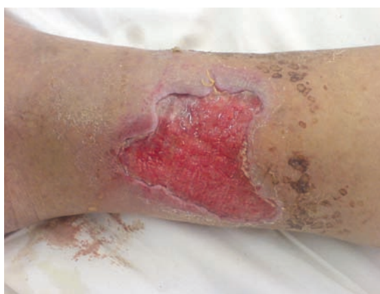
Рис. 3. Гранулирующая язва голени после подготовки к аутодермопластике методом ФДТ с использованием аппарата «Родник-1» и фотосенсибилизатора «Хлорофиллипт» (3–4-е сутки после хирургической обработки).