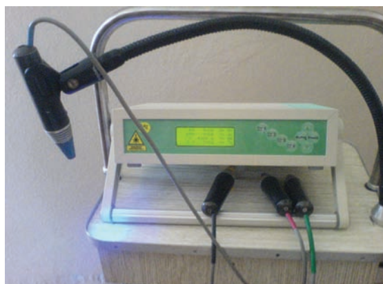
Рис. 2. Лазерный полупроводниковый аппарат «Родник-1».