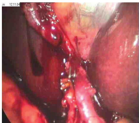
Рис. 2. Больной П., необычный вариант расположения печеночной артерии.

Кровотечения из пузырной артерии, возникшие у трех больных во время операции по поводу острого флегмонозного холецистита, были своевременно диагностированы и остановлены эндоскопически. У двух больных через 6 часов после лапарос-